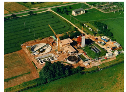
Ausbau auf 15.000 EW Inbetriebnahme 1987

Um dieses kostbare Gut zu schützen betreibt die Stadt Herbolzheim seit 1967 eine mechanisch -biologische Kläranlage. Diese ursprünglich für 6250 Einwohner ausgebaute Anlage wurde bis heute in mehreren Ausbausritten erweitert und an dem jeweiligen Stand von Wissenschaft und Technik ausgerichtet. Der Leistungsvergleich der kommunalen Kläranlagen in Baden-Württemberg bestätigt, dass die mittlerweile für 15.000 Einwohner-Gleichwerte ausgebaute Kläranlage, die gesetzlichen Grenzwerte einhält. Gleichwohl sind derzeit Planungen im Gange um die Anlage auch für kommende Jahre und Anforderungen zu rüsten. Der Anschlussgrad im Einzugsgebiet der Kläranlage beträgt nahezu 100%. Das so gereinigte Abwasser wird in die „Alte Elz“ eingeleitet und somit dem natürlichen Wasserkreislauf wieder zugeführt.